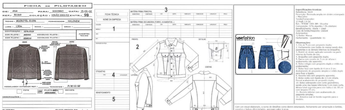
Figura 1 – Compilação das fichas trabalhadas.