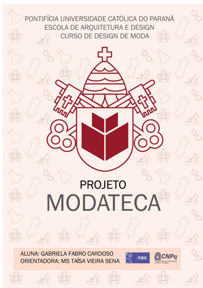
Figura 1. Capa da apostila das fichas da Modateca PUCPR.

Para que o projeto demonstrasse harmonia gráfica, as fichas e layout foram criados com o auxílio do programa Adobe Illustrator, tendo como base as fichas utilizadas no projeto Modateca da UDESC. Para ilustrar a capa do projeto, foram escolhidos elementos da moda como a bolsa, sapato, vestido, óculos e manequim. As fichas e a capa levam o símbolo da PUCPR, para evidenciar onde o projeto está sendo desenvolvido e onde as peças podem ser encontradas, a tipografia selecionada foi Franklin Gothic Book. Pode-se inserir que o design de moda e o design gráfico andam juntos, no caso do projeto Modateca, o auxílio digital se faz necessário, tanto para que haja uma estética satisfatória quanto para uma melhor e ágil catalogação dos objetos. Sobre o Design Gráfico na moda, Martins (2010) afirma que “[...] o design pode estar na estampa da camiseta como na produção de um catálogo da coleção.”, ou seja, o design gráfico pode ser inserido de diversas formas no âmbito da moda, inclusive na criação das fichas, como é o caso do presente projeto.