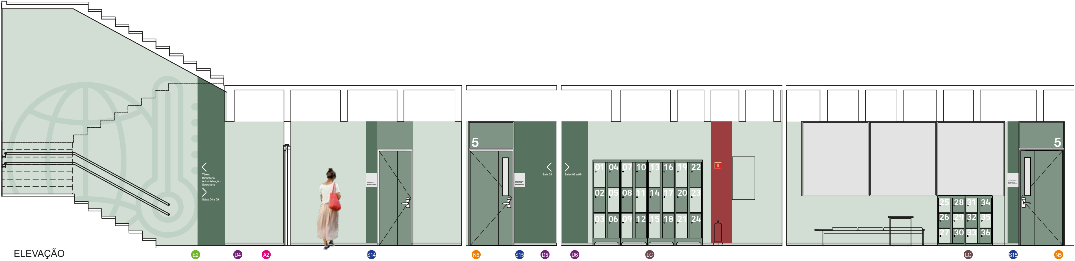
ELEVAÇÃO ESC.: 1:50