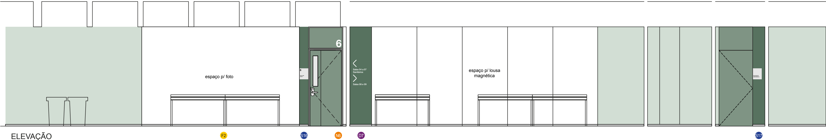
ELEVAÇÃO ESC.: 1:50