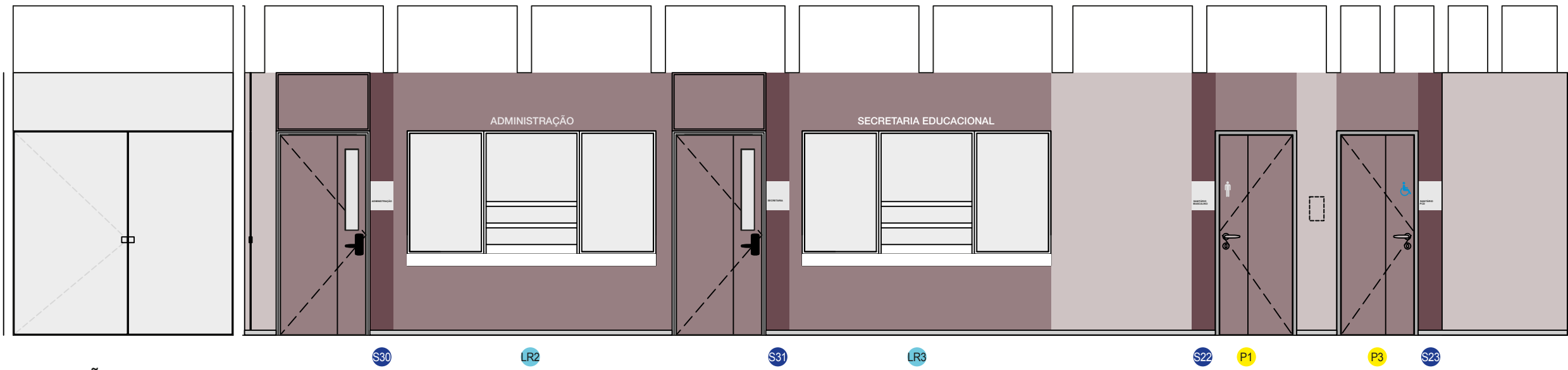
ELEVAÇÃO ESC.: 1:50