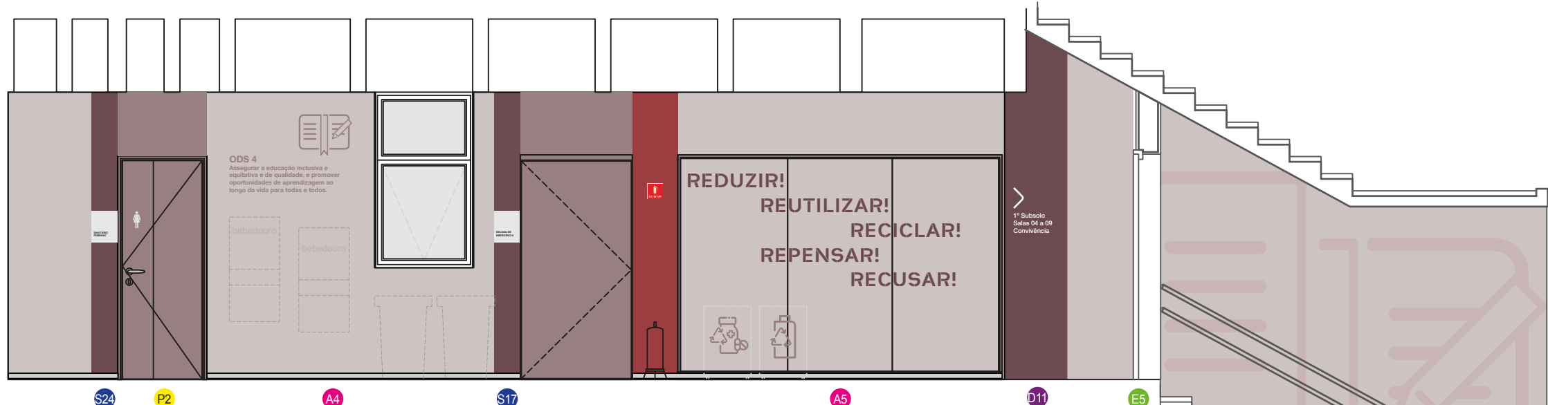
ELEVAÇÃO ESC.: 1:50

Todas as medidas em centímetros. Conferir todas as medidas no local.