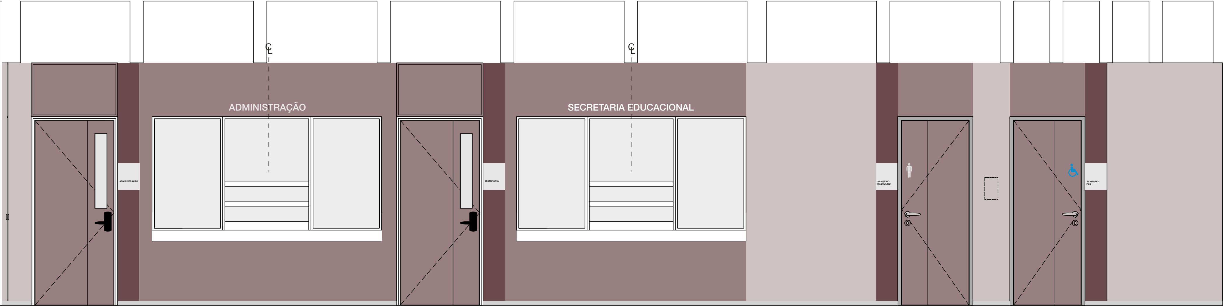
ADMINISTRAÇÃO E BIBLIOTECA ESC.: 1:25