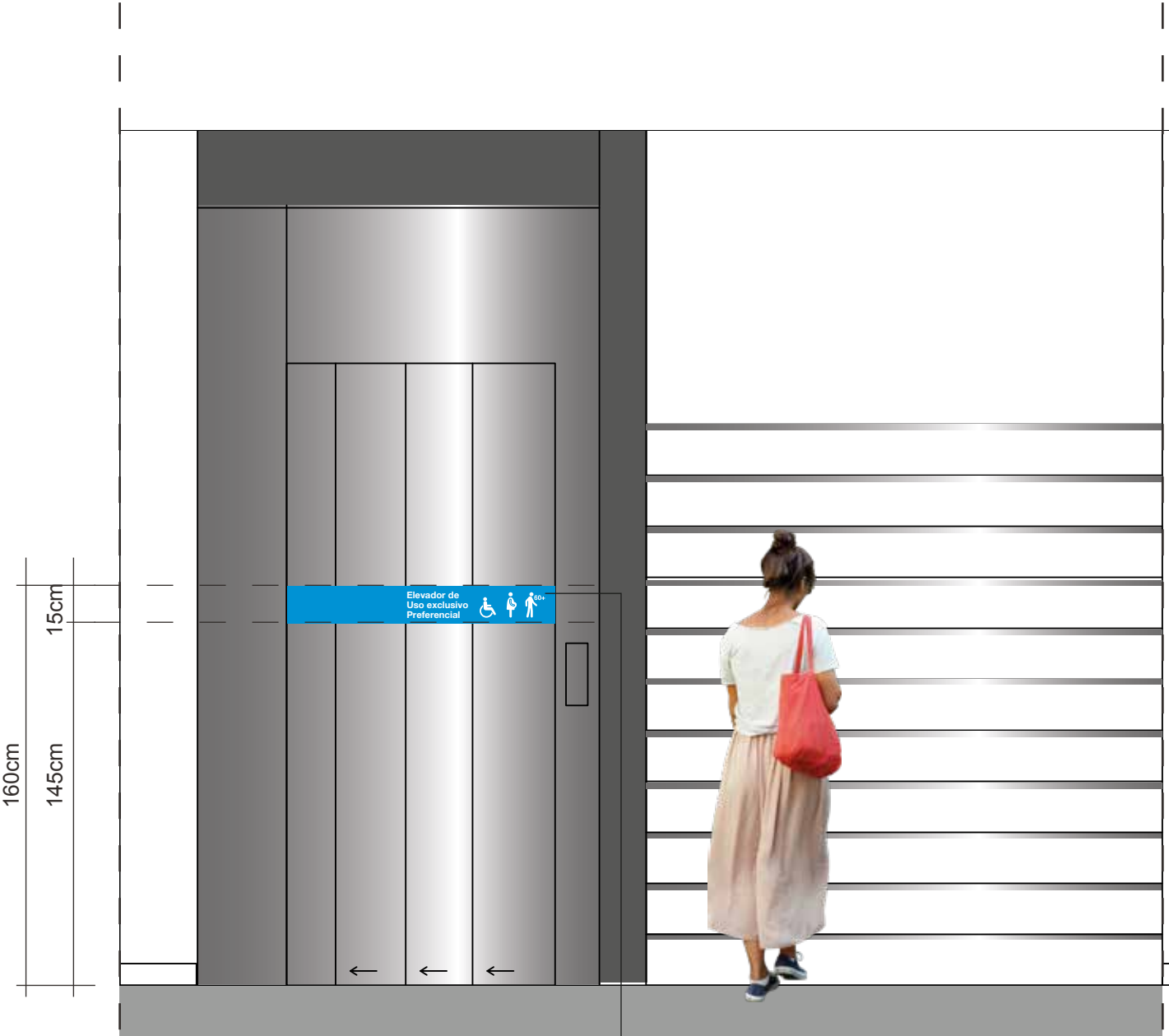
ELEVAÇÃO 2 - ELEVADOR E ESCADA ESC.: 1:25 Faixa de elevador em película adesiva.