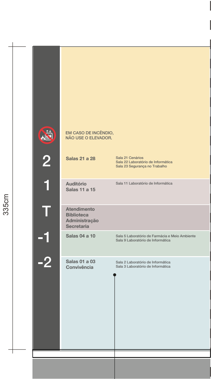
ELEVAÇÃO 1 ESC.: 1:25 Parade pintada com textos adesivados