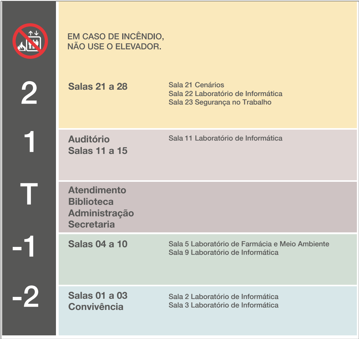
DIRETÓRIO DE ELEVADOR ESC.: 1:12,5

Todas as medidas em centímetros. Conferir todas as medidas no local.