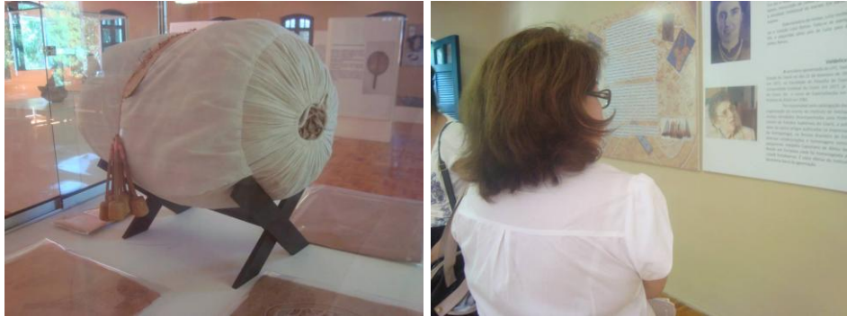
Imagem 2: Visita ao acervo de Rendas da Casa José de Alencar

As pesquisas desenvolvidas no PET Naïf visaram acrescentar à formação do estudante do curso de Design-Moda, conhecimentos que auxiliam na prática consciente do design em sua relação com os bens culturais, neste caso, o artesanato. Para tanto, o grupo de estudos pautou-se no desenvolvimento de atividades que contemplaram tanto o levantamento de material bibliográfico, a fim de se estabelecer uma fundamentação teórica pertinente aos estudos, como a realização de atividades mais associadas ao ambiente empírico que foram desenvolvidas a partir do contato direto com as técnicas artesanais.