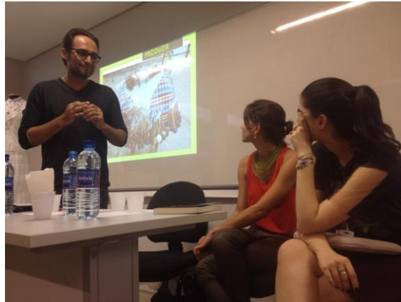
Imagem 1: Mesa Redonda "Artesanato, design e indústria: interseções criativas"

produtos que atendam às demandas sociais e ambientais de sustentabilidade por parte dos estudantes de design.