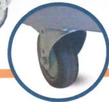
Rodas com travas.