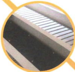
Organizador de cabos. Passador de Fios.