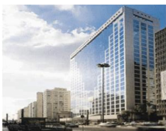
São Paulo – SP Av. Paulista

A VITARA está sediada na cidade de São Paulo , com operações e clientes em diversas localidades do Brasil, como: Rio de Janeiro, Porto Alegre, Fortaleza, Campo Grande e Belo Horizonte .