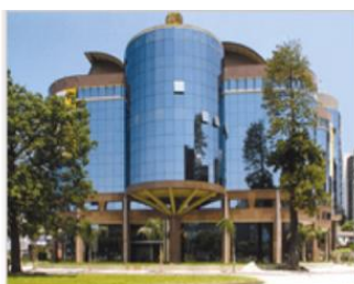
Rio de Janeiro - RJ Praia de Botafogo