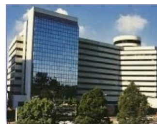
Bogotá – Colômbia World Trade Center